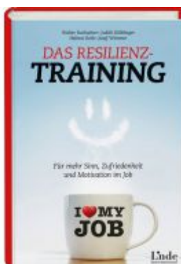
Das Resilienz-Training Ladenpreis: 24,90 EUR