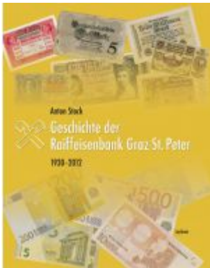
Geschichte der Raiffeisenbank Graz-St. Peter Ladenpreis: 29,90 EUR