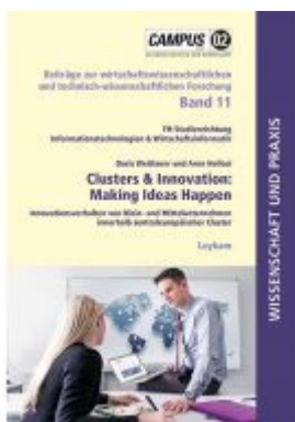
Clusters & Innovation: Making Ideas Happen Ladenpreis: 14,90 EUR