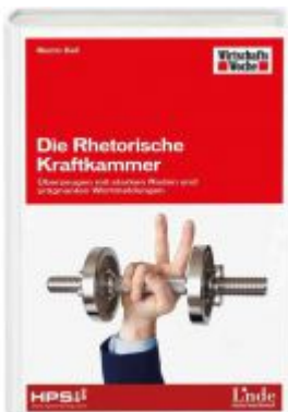
Die Rhetorische Kraftkammer Ladenpreis: 24,90 EUR

Wir haben andere Produkte gefunden, die Ihnen gefallen könnten!