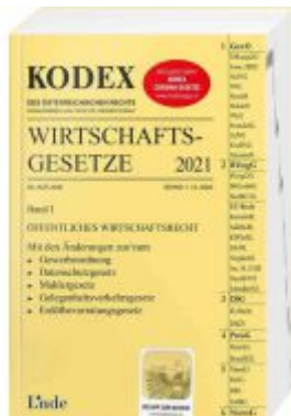
KODEX Wirtschaftsgesetze Band I 2021 Ladenpreis: 59,00 EUR