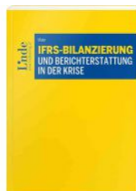
IFRS-Bilanzierung und Berichterstattung in der Krise Ladenpreis: 56,00 EUR