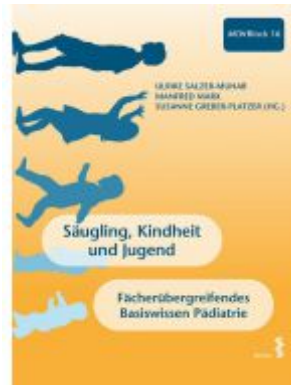
Säugling, Kindheit und Jugend Ladenpreis: 34,90 EUR