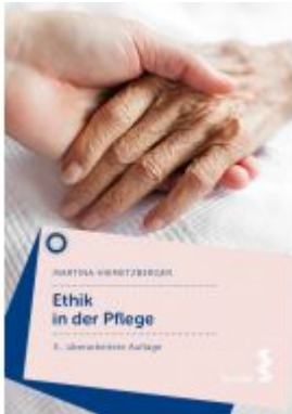
Ethik in der Pflege Ladenpreis: 19,90 EUR