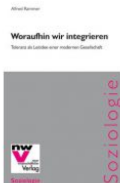
Woraufhin wir integrieren Ladenpreis: 32,80 EUR