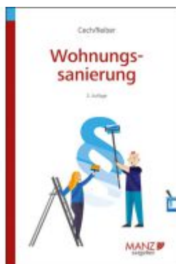
Wohnungsanierung Ladenpreis: 23,80EUR