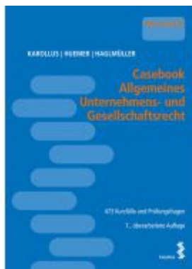
Casebook Allgemeines Unternehmens- und Gesellschaftsrecht Ladenpreis: 40,00EUR