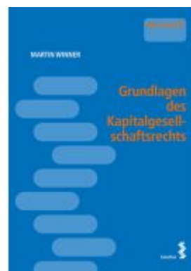
Grundlagen des Kapitalgesellschaftsrechts Ladenpreis: 18,00EUR