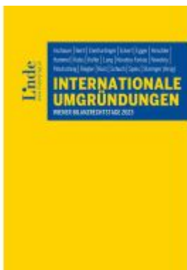
Internationale Umgründungen Ladenpreis: 58,00EUR