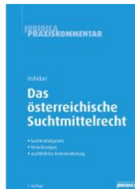
Das österreichische Suchtmittelrecht Ladenpreis: 59,00EUR