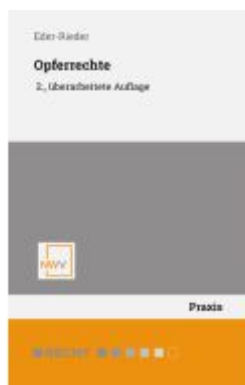
Opferrechte Ladenpreis: 48,00EUR