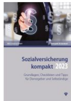
Sozialversicherung kompakt 2023