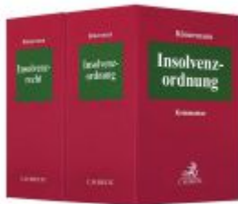
Insolvenzordnung (InsO) / Insolvenzrecht (InsR) Ladenpreis: 112,10EUR