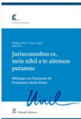
Jurisconsultus es, iuris nihil a te alienum putamus Ladenpreis: 198,80EUR