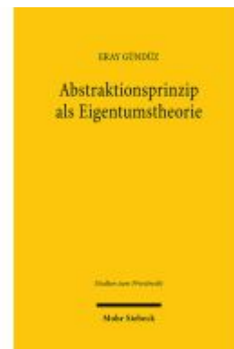
Abstraktionsprinzip als Eigentumstheorie Ladenpreis: 50,40EUR