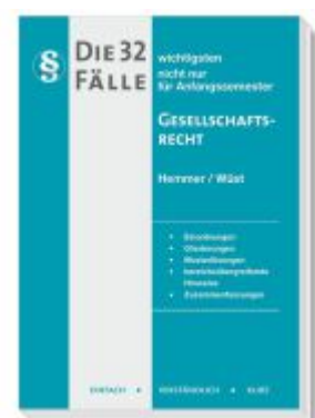
Die 32 wichtigsten Fälle Gesellschaftsrecht Ladenpreis: 16,40EUR