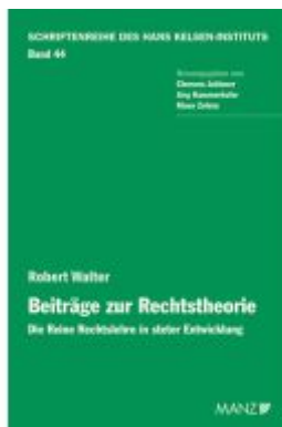
Robert Walter. Beiträge zur Rechtstheorie Ladenpreis: 68,00EUR