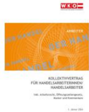
Kollektivvertrag für Handelsarbeiter:Innen 2025 Ladenpreis: 10,50EUR