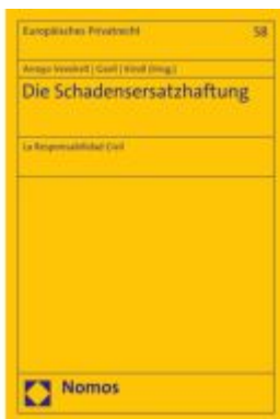
Die Schadensersatzhaftung Ladenpreis: 81,30EUR