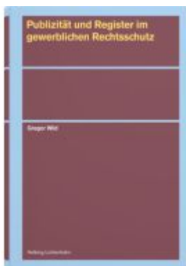
Publizität und Register im gewerblichen Rechtsschutz Ladenpreis: 108,00EUR