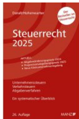
Steuerrecht 2025 Ladenpreis: 39,00EUR