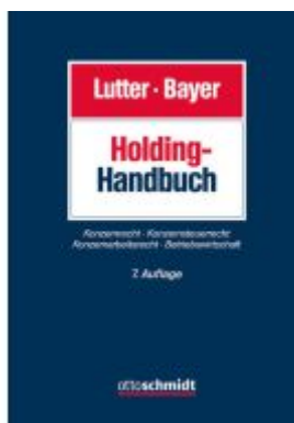
Holding-Handbuch Ladenpreis: 266,30EUR