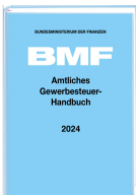
Amtliches Gewerbesteuer-Handbuch 2024 Ladenpreis: 10,80EUR