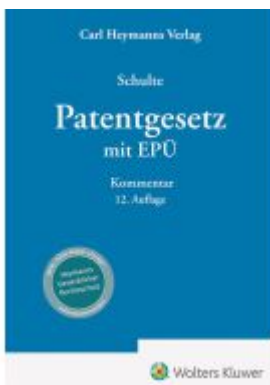
Patentgesetz mit Europäischem Patentübereinkommen Ladenpreis: 297,10EUR