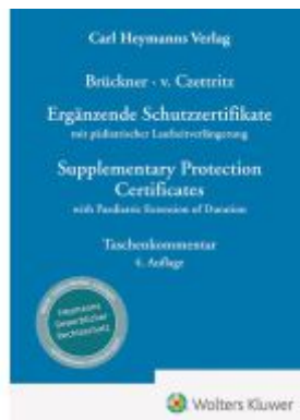
Ergänzende Schutzzertifikate / Supplementary Protection Certificates Ladenpreis: 379,40EUR