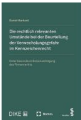
Die rechtlich relevanten Umstände bei der Beurteilung der Verwechslungsgefahr im Kennzeichenrecht Ladenpreis: 112,10EUR