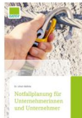
Notfallplanung für Unternehmerinnen und Unternehmer Ladenpreis: 22,66EUR