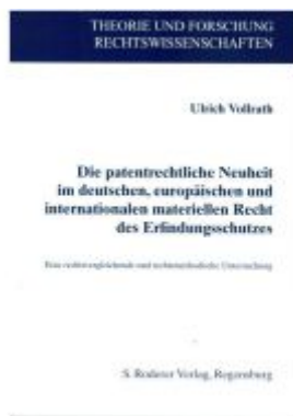
Die patentrechtliche Neuheit im deutschen, europäischen und internationalen materiellen Recht des Erfindungsschutzes Ladenpreis: 74,10EUR