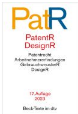
Patent- und Designrecht Ladenpreis: 18,40EUR

Wir haben andere Produkte gefunden, die Ihnen gefallen könnten!