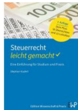
Steuerrecht – leicht gemacht. Ladenpreis: 16,40EUR