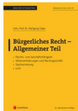
Bürgerliches Recht - Allgemeiner Teil (Skriptum) Ladenpreis: 26,25EUR