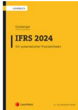
IFRS 2024 Ladenpreis: 49,00EUR