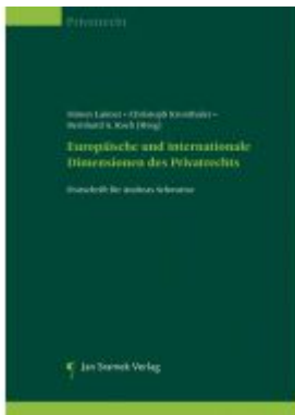
Europäische und internationale Dimensionen des Privatrechts Ladenpreis: 128,00EUR