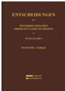
Entscheidungen des Obersten Gerichtshofes in Zivilsachen Ladenpreis: 186,00EUR