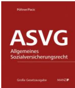
Allgemeine Sozialversicherung ASVG Ladenpreis: 338,00EUR