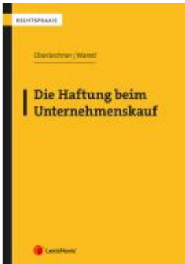
Die Haftung beim Unternehmenskauf Ladenpreis: 57,00EUR