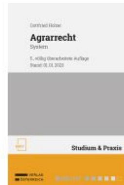
Agrarrecht Ladenpreis: 88,00EUR