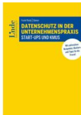
Datenschutz in der Unternehmenspraxis Ladenpreis: 55,00EUR