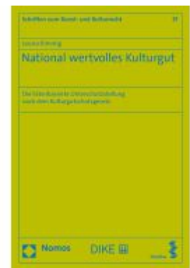
National wertvolles Kulturgut Ladenpreis: 139,90EUR

Alle Preise inkl. MwSt. zzgl. Versand. Bei Bestellung im LexisNexis Onlineshop kostenloser Versand innerhalb Österreichs.