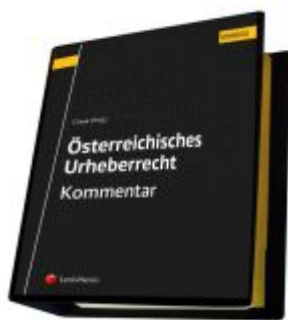
Österreichisches Urheberrecht Ladenpreis: 289,00EUR