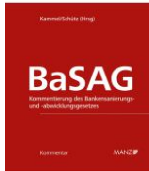
BaSAG - Bankensanierungs- und -abwicklungsgesetz Ladenpreis: 298,00EUR