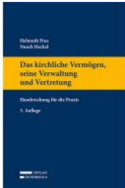
Das kirchliche Vermögen, seine Verwaltung und Vertretung Ladenpreis: 79,00EUR

Wir haben andere Produkte gefunden, die Ihnen gefallen könnten!