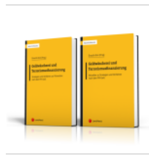
PAKET Geldwäsche und Terrorismusfinanzierung Ladenpreis: 52,00EUR