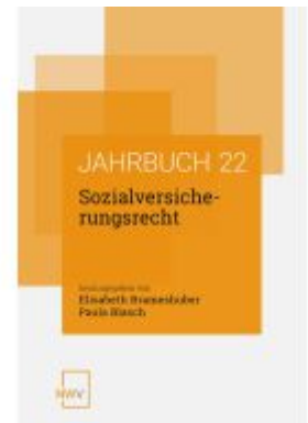
Sozialversicherungsrecht Ladenpreis: 68,00EUR