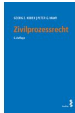
Zivilprozessrecht Ladenpreis: 52,00EUR