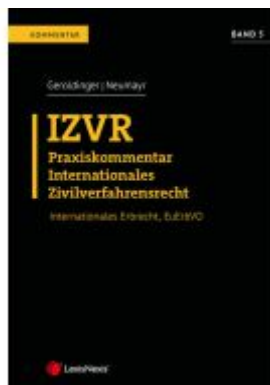
IZVR Praxiskommentar Internationales Zivilverfahrensrecht Ladenpreis: 149,00EUR