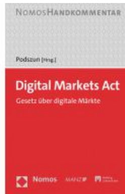
Digital Markets Act Ladenpreis: 134,00EUR