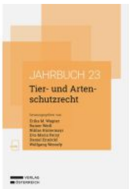
Tier- und Artenschutzrecht Ladenpreis: 78,00EUR