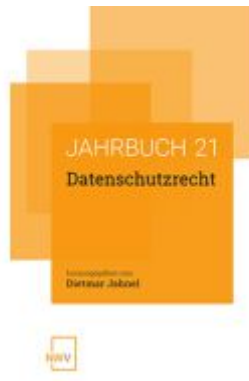
Datenschutzrecht Ladenpreis: 58,00EUR