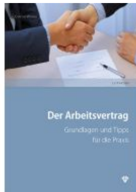
Der Arbeitsvertrag Ladenpreis: 33,00EUR