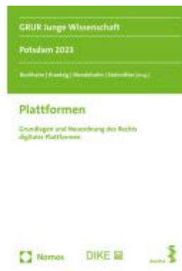
Plattformen Ladenpreis: 60,70EUR