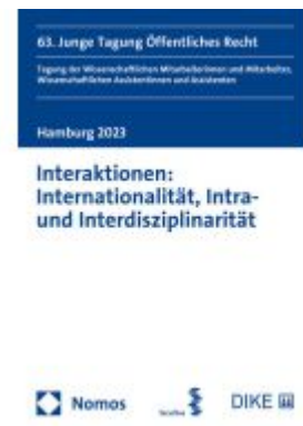
Interaktionen: Internationalität, Intra- und Interdisziplinarität Ladenpreis: 81,30EUR