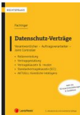
Datenschutz-Verträge Ladenpreis: 69,00EUR