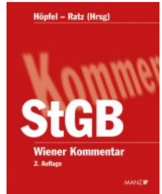
Wiener Kommentar zum Strafgesetzbuch 2. Auflage Ladenpreis: 765,00EUR