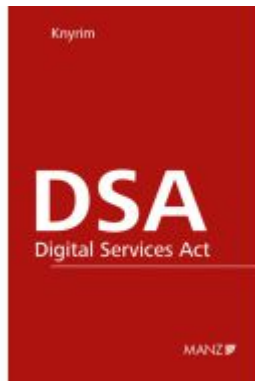
DSA - Digital Services Act Ladenpreis: 54,00EUR

Wir haben andere Produkte gefunden, die Ihnen gefallen könnten!