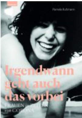
Irgendwann geht auch das vorbei Ladenpreis: 24,00EUR