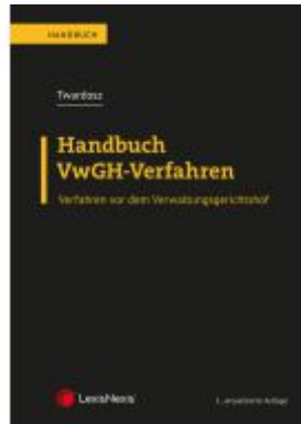
Handbuch VwGH-Verfahren Ladenpreis: 69,00EUR