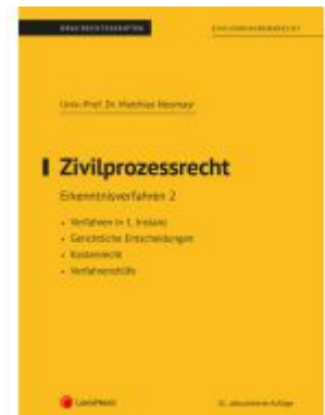
Zivilprozessrecht Erkenntnisverfahren 2 (Skriptum) Ladenpreis: 26,25EUR