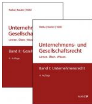
PAKET: Unternehmensrecht + Gesellschaftsrecht Ladenpreis: 97,00 EUR