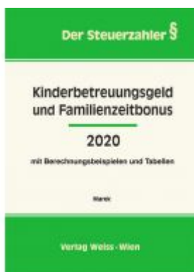
Kinderbetreuungsgeld und Familienzeitbonus 2020 Ladenpreis: 33,00 EUR