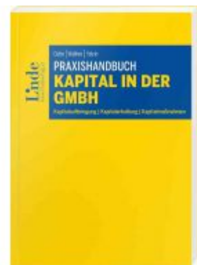
Praxishandbuch Kapital in der GmbH Ladenpreis: 55,00 EUR