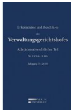
Erkenntnisse und Beschlüsse des Verwaltungsgerichtshofes Ladenpreis: 476,00 EUR