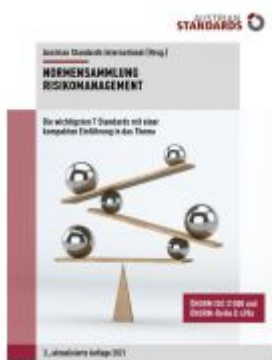
Normensammlung Risikomanagement Ladenpreis: 241,50 EUR