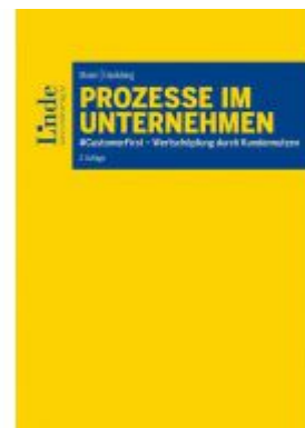
Prozesse im Unternehmen Ladenpreis: 39,00 EUR