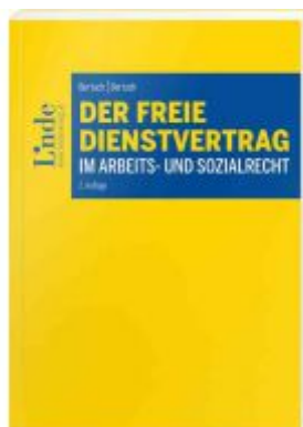
Der freie Dienstvertrag im Arbeits- und Sozialrecht Ladenpreis: 54,00 EUR