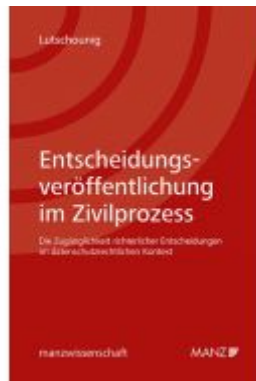
Entscheidungsveröffentlichung im Zivilprozess Ladenpreis: 52,00 EUR