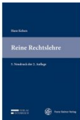
Reine Rechtslehre Ladenpreis: 79,00 EUR