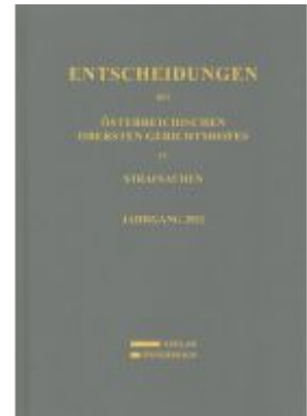
Entscheidungen des Österreichischen Obersten Gerichtshofes in Strafsachen Ladenpreis: 139,00EUR