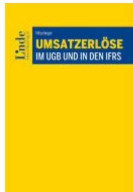
Umsatzerlöse im UGB und in den IFRS Ladenpreis: 78,00EUR