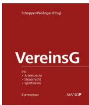
Vereinsgesetz Ladenpreis: 239,00EUR