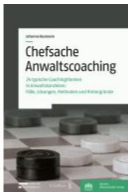
Chefsache Anwaltscoaching Ladenpreis: 83,00EUR