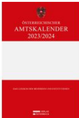
Österreichischer Amtskalender 2023/2024 Ladenpreis: 328,00EUR