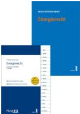
Kombipaket Energierecht und FlexLex Energierecht Ladenpreis: 48,00EUR