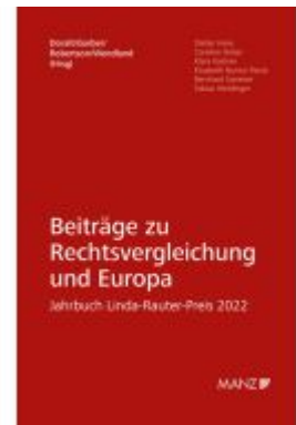
Beiträge zu Rechtsvergleichung und Europa Jahrbuch Linda-Rauter-Preis 2022 Ladenpreis: 89,00EUR