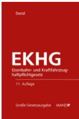
Eisenbahn- und Kraftfahrzeughaftpflichtgesetz EKHG Ladenpreis: 158,00EUR