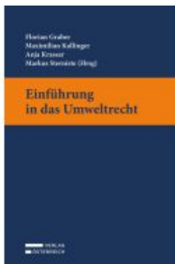
Einführung in das Umweltrecht Ladenpreis: 32,00EUR