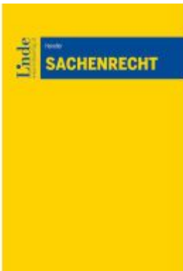
Sachenrecht Ladenpreis: 40,00EUR