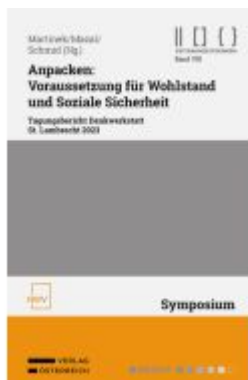
Anpacken: Voraussetzung für Wohlstand und Soziale Sicherheit Ladenpreis: 38,00EUR

Wir haben andere Produkte gefunden, die Ihnen gefallen könnten!