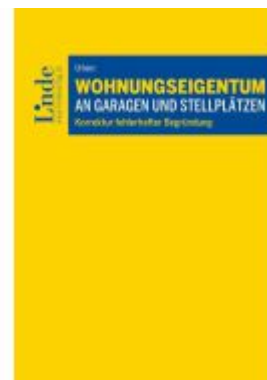
Wohnungseigentum an Garagen und Stellplätzen Ladenpreis: 64,00EUR