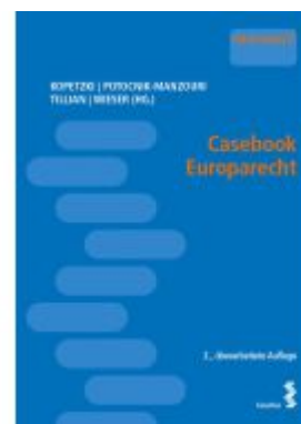
Casebook Europarecht Ladenpreis: 29,00EUR

Alle Preise inkl. MwSt. zzgl. Versand. Bei Bestellung im LexisNexis Onlineshop kostenloser Versand innerhalb Österreichs.