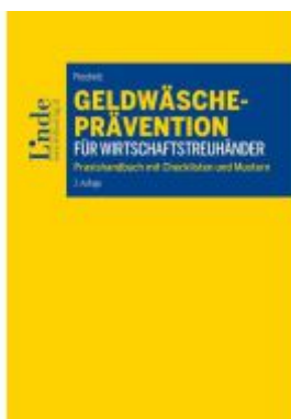
Geldwäscheprävention für Wirtschaftstreuhandler Ladenpreis: 34,00EUR