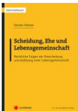
Scheidung, Ehe und Lebensgemeinschaft Ladenpreis: 79,00EUR