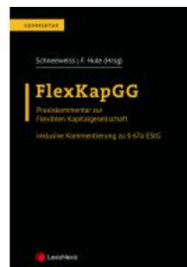
FlexKapGG Ladenpreis: 95,00EUR