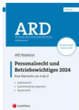
Personalrecht und Betriebswichtiges 2024 Ladenpreis: 89,00EUR