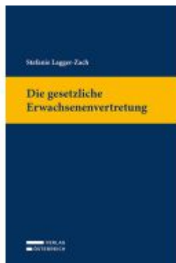
Die gesetzliche Erwachsenenvertretung Ladenpreis: 79,00EUR