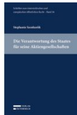
Die Verantwortung des Staates für seine Aktiengesellschaften Ladenpreis: 49,00EUR