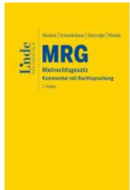
MRG | Mietrechtsgesetz Ladenpreis: 128,00EUR