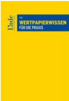
Wertpapierwissen für die Praxis Ladenpreis: 129,00EUR