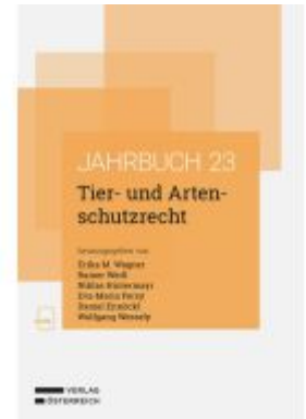
Tier- und Artenschutzrecht Ladenpreis: 78,00EUR