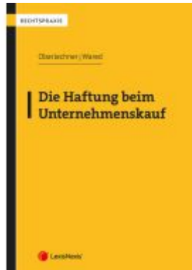
Die Haftung beim Unternehmenskauf Ladenpreis: 57,00EUR