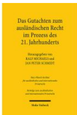
Das Gutachten zum ausländischen Recht im Prozess des 21. Jahrhunderts Ladenpreis: 82,30EUR