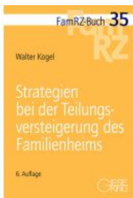
Strategien bei der Teilungsversteigerung des Familienheims Ladenpreis: 71,00EUR