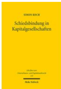
Schiedsbindung in Kapitalgesellschaften Ladenpreis: 86,40EUR