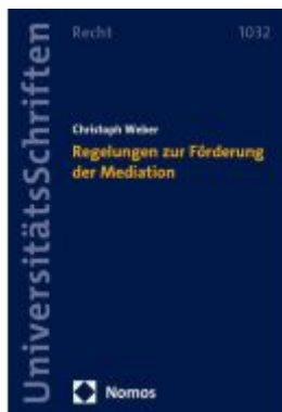
Regelungen zur Förderung der Mediation Ladenpreis: 127,50EUR