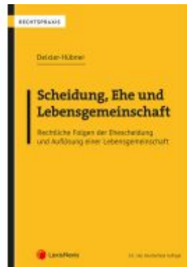
Scheidung, Ehe und Lebensgemeinschaft Ladenpreis: 79,00EUR