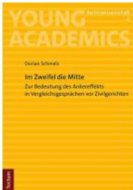
Im Zweifel die Mitte Ladenpreis: 50,40EUR