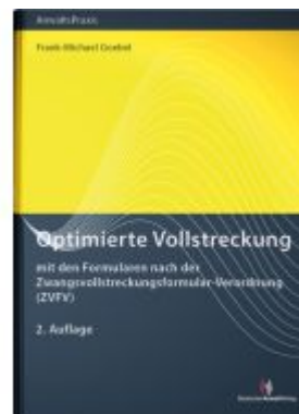
Optimierte Vollstreckung Ladenpreis: 55,60EUR