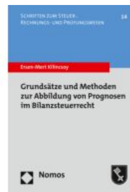
Grundsätze und Methoden zur Abbildung von Prognosen im Bilanzsteuerrecht Ladenpreis: 86,40EUR