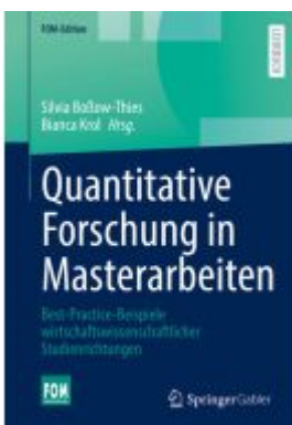
Quantitative Forschung in Masterarbeiten Ladenpreis: 46,25EUR