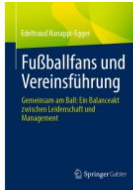
Fußballfans und Vereinsführung Ladenpreis: 46,25EUR