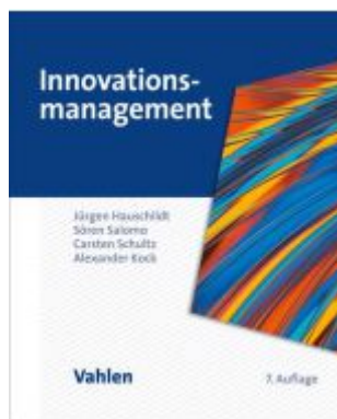
Innovationsmanagement Ladenpreis: 41,00EUR