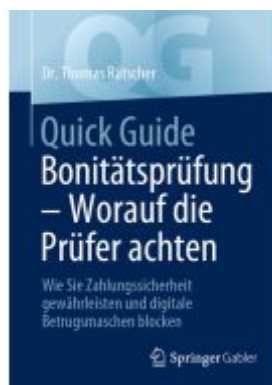
Quick Guide Bonitätsprüfung – Worauf die Prüfer achten Ladenpreis: 25,69EUR