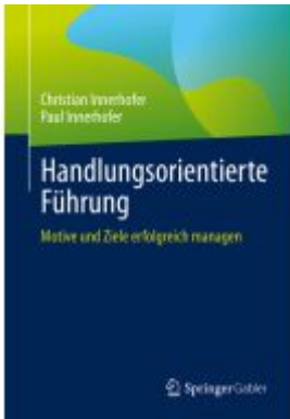
Handlungsorientierte Führung Ladenpreis: 51,39EUR