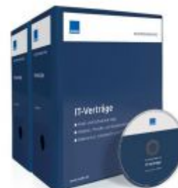
Mustersammlung IT-Verträge Ladenpreis: 228,90 EUR