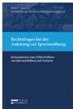
Rechtsfragen bei der Anleitung zur Sportausübung Ladenpreis: 39,00 EUR