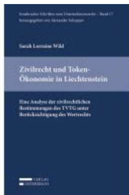
Zivilrecht und Token-Ökonomie in Liechtenstein Ladenpreis: 39,00 EUR