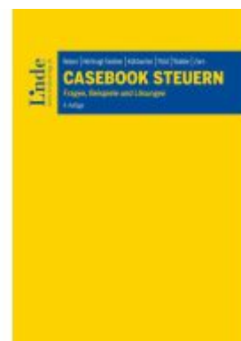
Casebook Steuern Ladenpreis: 72,00EUR