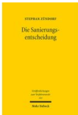
Die Sanierungsentscheidung Ladenpreis: 133,70EUR

Wir haben andere Produkte gefunden, die Ihnen gefallen könnten!