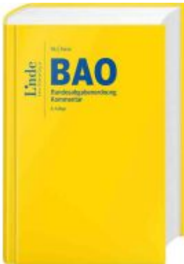
BAO | Bundesabgabenordnung Ladenpreis: 336,00EUR