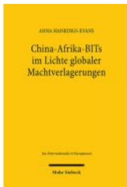
China-Afrika-BITs im Lichte globaler Machtverlagerungen Ladenpreis: 101,80EUR