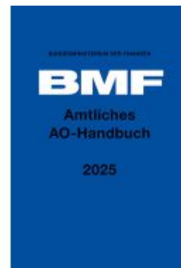
Amtliches AO-Handbuch 2025 Ladenpreis: 24,20EUR