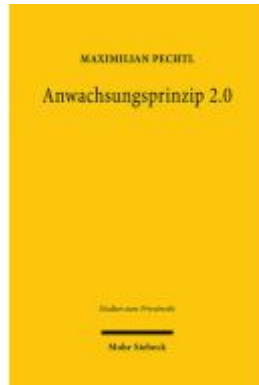
Anwachsungsprinzip 2.0 Ladenpreis: 112,10EUR