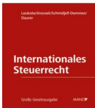
Internationales Steuerrecht Ladenpreis: 498,00EUR