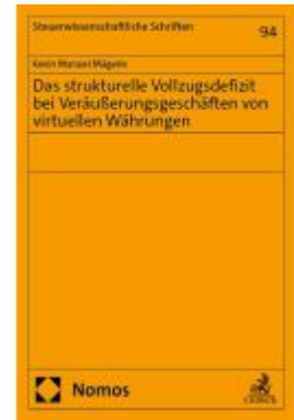
Das strukturelle Vollzugsdefizit bei Veräußerungsgeschäften von virtuellen Währungen Ladenpreis: 107,00EUR