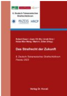
Das Strafrecht der Zukunft Ladenpreis: 91,40EUR