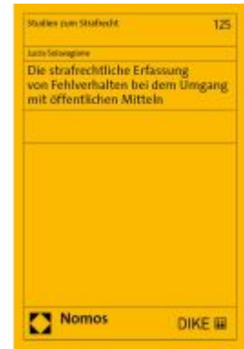
Die strafrechtliche Erfassung von Fehlverhalten bei dem Umgang mit öffentlichen Mitteln Ladenpreis: 76,10EUR