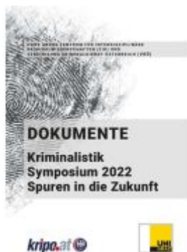
Dokumente Ladenpreis: 19,90EUR