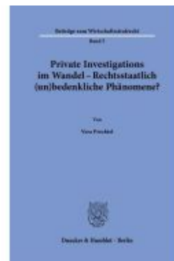
Private Investigations im Wandel – Rechtsstaatlich (un)bedenkliche Phänomene? Ladenpreis: 92,50EUR