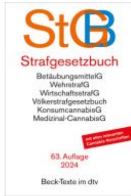
Strafgesetzbuch Ladenpreis: 13,30EUR