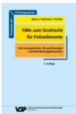
Fälle zum Strafrecht für Polizeibeamte Ladenpreis: 25,60EUR