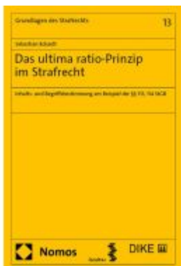
Das ultima ratio-Prinzip im Strafrecht Ladenpreis: 112,10EUR

Wir haben andere Produkte gefunden, die Ihnen gefallen könnten!