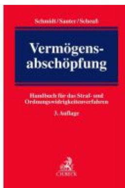
Vermögensabschöpfung Ladenpreis: 138,80EUR