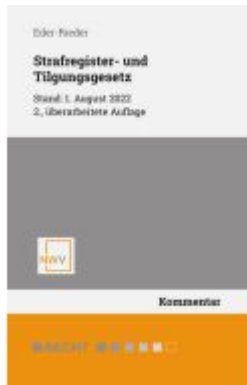
Strafregister- und Tilgungsgesetz Ladenpreis: 68,00EUR