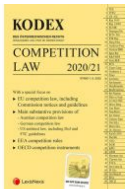
KODEX Competition Law Ladenpreis: 46,00 EUR