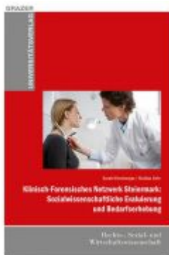
Klinisch-Forensisches Netzwerk Steiermark: Sozialwissenschaftliche Evaluierung und Bedarfserhebung Ladenpreis: 12,90 EUR