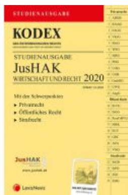
KODEX JusHAK Ladenpreis: 23,00 EUR