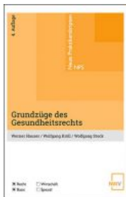
Grundzüge des Gesundheitsrechts Ladenpreis: 24,00 EUR