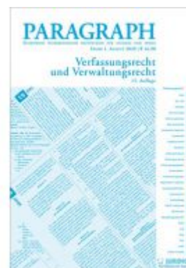
Paragraph - Verfassungs- und Verwaltungsrecht Ladenpreis: 16,90 EUR