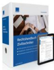
Rechtshandbuch Ziviltechniker Ladenpreis: 207,90 EUR