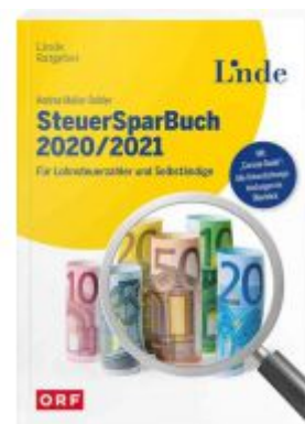
SteuerSparBuch 2020/2021 Ladenpreis: 29,90 EUR