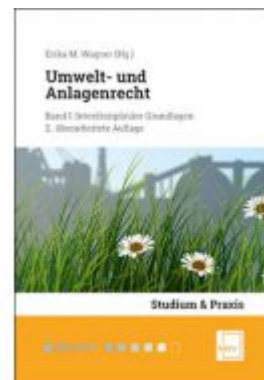
Umwelt- und Anlagenrecht Ladenpreis: 68,00 EUR