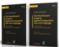
Angloamerikanische Rechtssprache / PAKET: The Practitioners' Guide to Applied Comparative Law and Language Ladenpreis: 142,40 EUR