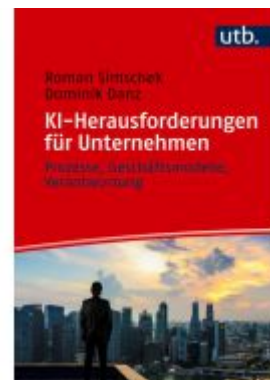
KI-Herausforderungen für Unternehmen Ladenpreis: 25,60EUR