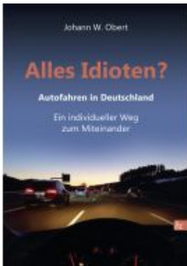
Alles Idioten? Ladenpreis: 20,60EUR