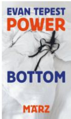
Power Bottom Ladenpreis: 18,50EUR