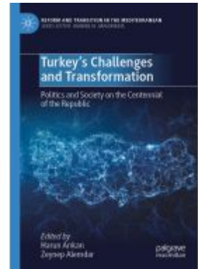
Turkey's Challenges and Transformation Ladenpreis: 153,99EUR