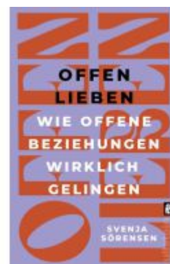
Offen lieben Ladenpreis: 15,50EUR