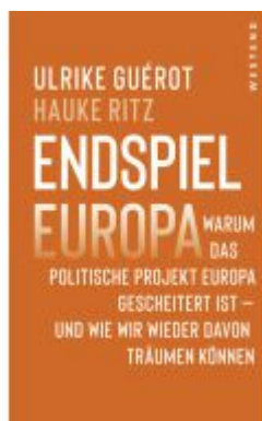
Endspiel Europa Ladenpreis: 20,60EUR