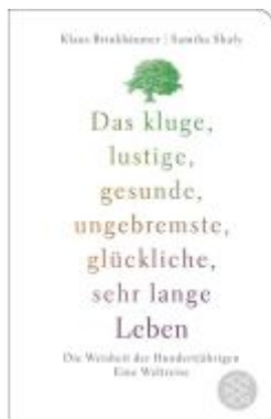
Das kluge, lustige, gesunde, ungebremste, glückliche, sehr lange Leben Ladenpreis: 17,50EUR