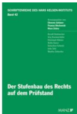
Der Stufenbau des Rechts auf dem Prüfstand Ladenpreis: 38,00EUR