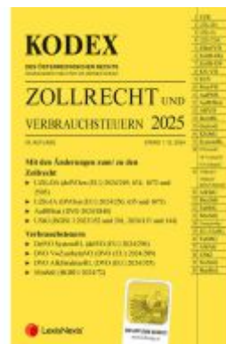
KODEX Zollrecht 2025 - inkl. App Ladenpreis: 119,00EUR