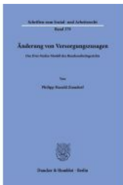
Änderung von Versorgungszusagen. Ladenpreis: 102,70EUR