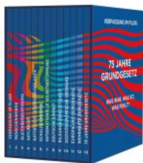
Verfassung im Fluss Ladenpreis: 18,50EUR