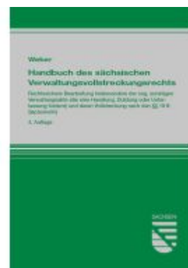
Handbuch des sächsischen Verwaltungsvollstreckungsrechts Ladenpreis: 39,00EUR