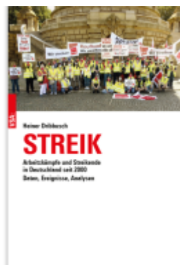
STREIK Ladenpreis: 30,70EUR