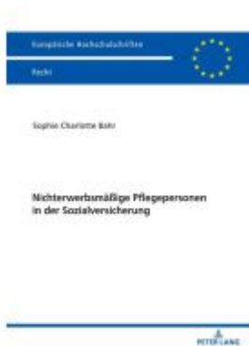
Nichterwerbsmäßige Pflegepersonen in der Sozialversicherung Ladenpreis: 77,10EUR