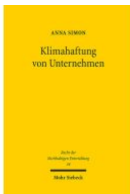
Klimahaftung von Unternehmen Ladenpreis: 71,00EUR