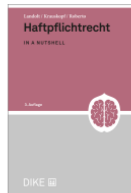
Haftpflichtrecht Ladenpreis: 64,00EUR