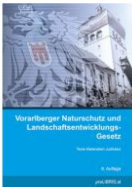
Vorarlberger Naturschutz und Landschaftsentwicklung-Gesetz Ladenpreis: 26,00EUR