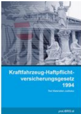
Kraftfahrzeug-Haftpflichtversicherungsgesetz 1994 Ladenpreis: 14,00EUR