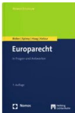
Europarecht Ladenpreis: 42,00EUR