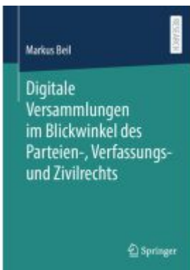
Digitale Versammlungen im Blickwinkel des Parteien-, Verfassungs- und Zivilrechts Ladenpreis: 92,51EUR