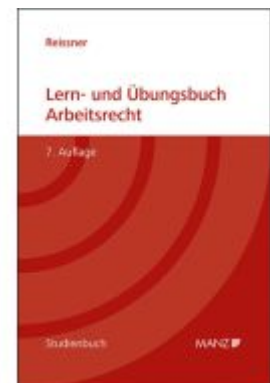
Lern- und Übungsbuch Arbeitsrecht Ladenpreis: 66,00EUR