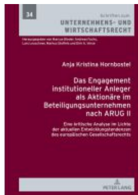
Das Engagement institutioneller Anleger als Aktionäre im Beteiligungsunternehmen nach ARUG II Ladenpreis: 87,30EUR