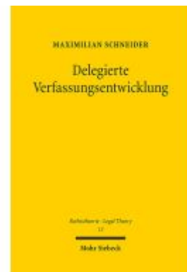
Delegierte Verfassungsentwicklung Ladenpreis: 96,70EUR