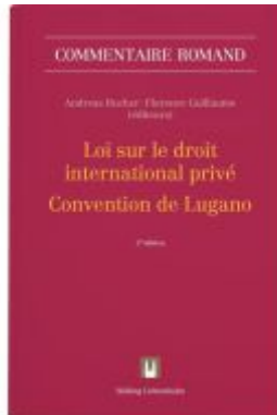
Loi sur le droit international privé - Convention de Lugano Ladenpreis: 658,00EUR