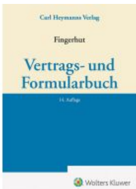
Vertrags- und Formularbuch Ladenpreis: 122,40EUR