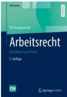
Arbeitsrecht Ladenpreis: 35,97EUR