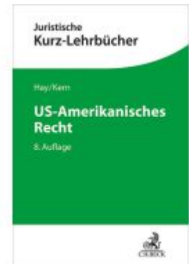
US-Amerikanisches Recht Ladenpreis: 46,20EUR