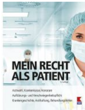
Mein Recht als Patient Ladenpreis: 25,00EUR