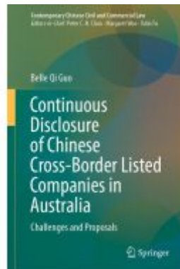
Continuous Disclosure of Chinese Cross- Border Listed Companies in Australia Ladenpreis: 175,99EUR