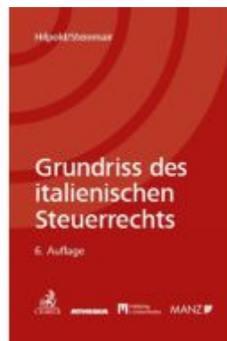
Grundriss des italienischen Steuerrechts Ladenpreis: 79,00EUR