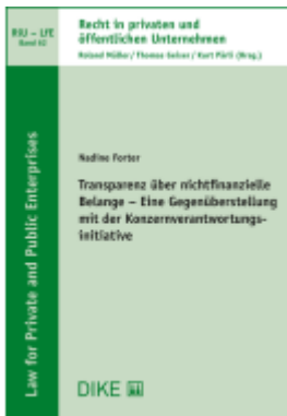
Transparenz über nichtfinanzielle Belange - Eine Gegenüberstellung mit der Konzernverantwortungsinitiative Ladenpreis: 68,00EUR