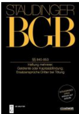
J. von Staudingers Kommentar zum Bürgerlichen Gesetzbuch mit Einführungsgesetz... / §§ 840-853 Ladenpreis: 179,95EUR