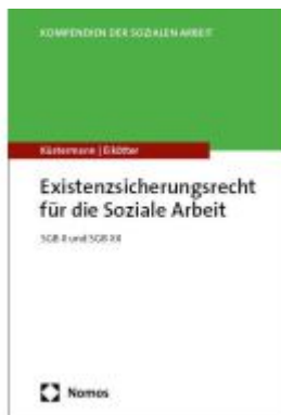
Existenzsicherungsrecht für die Soziale Arbeit Ladenpreis: 30,80EUR