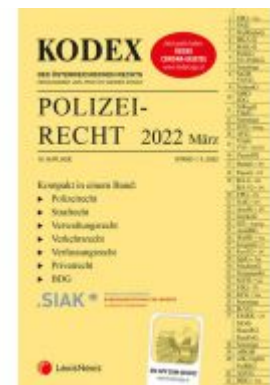
KODEX Polizeirecht 2022 März - inkl. App Ladenpreis: 58,00 EUR