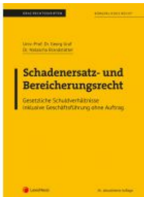
Bürgerliches Recht - Schadenersatz- und Bereicherungsrecht (Skriptum) Ladenpreis: 18,00 EUR