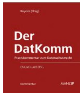
Der DatKomm Ladenpreis: 248,00 EUR