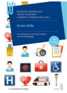
Erste Hilfe Ladenpreis: 26,90 EUR