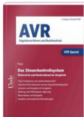
AVR-Spezial Das Steuerkontrollsystem Ladenpreis: 40,00 EUR