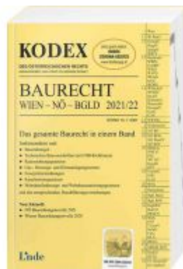
KODEX Baurecht Wien - NÖ - BglD 2021/22 Ladenpreis: 65,00 EUR