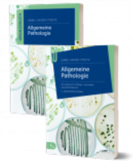
Lernpaket Allgemeine Pathologie Ladenpreis: 41,90 EUR