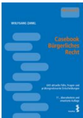
Casebook Bürgerliches Recht Ladenpreis: 37,00 EUR