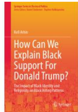
How Can We Explain Black Support For Donald Trump? Ladenpreis: 142,99EUR