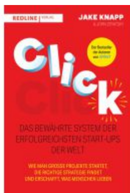
Click – Das bewährte System der erfolgreichsten Start-ups der Welt Ladenpreis: 22,70EUR