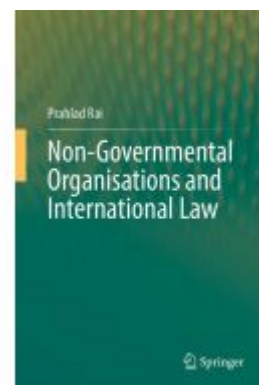
Non-Governmental Organisations and International Law Ladenpreis: 153,99EUR