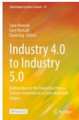
Industry 4.0 to Industry 5.0 Ladenpreis: 43,99EUR