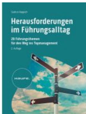
Herausforderungen im Führungsalltag Ladenpreis: 41,20EUR

Wir haben andere Produkte gefunden, die Ihnen gefallen könnten!