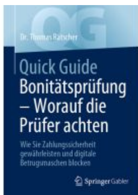
Quick Guide Bonitätsprüfung – Worauf die Prüfer achten Ladenpreis: 25,69EUR