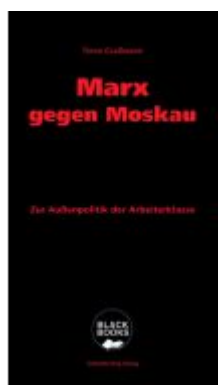
Marx gegen Moskau Ladenpreis: 17,30EUR