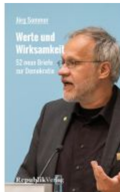
Werte und Wirksamkeit Ladenpreis: 15,30EUR