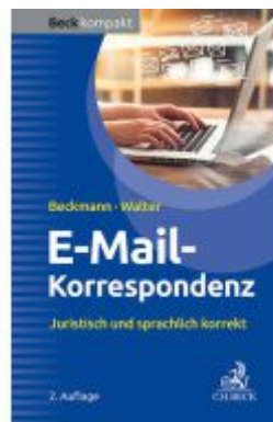
E-Mail-Korrespondenz Ladenpreis: 15,40EUR