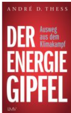
Der Energiegipfel Ladenpreis: 22,70EUR

Wir haben andere Produkte gefunden, die Ihnen gefallen könnten!