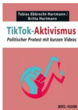
TikTok-Aktivismus Ladenpreis: 10,30EUR