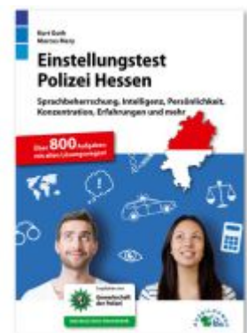
Einstellungstest Polizei Hessen Ladenpreis: 19,50EUR