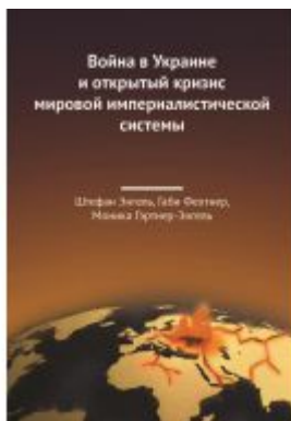
Война в Украине и открытый кризис мировой империалистической системы Ladenpreis: 5,00EUR