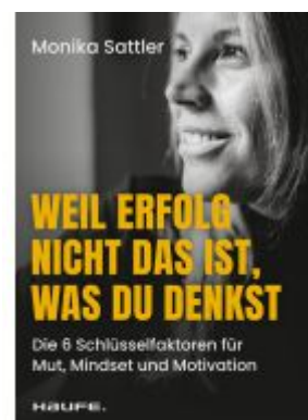
Weil Erfolg nicht das ist, was du denkst Ladenpreis: 30,90EUR