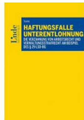
Haftungsfalle Unterentlohnung Ladenpreis: 66,00 EUR