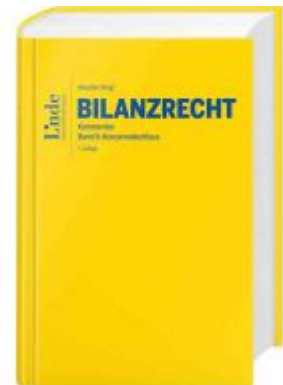
Bilanzrecht Ladenpreis: 118,00 EUR