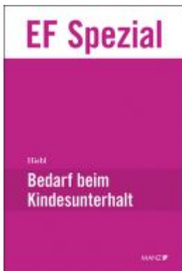
Bedarf beim Kindesunterhalt Ladenpreis: 74,00 EUR