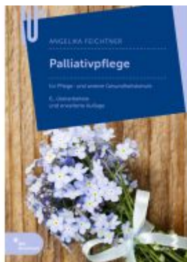
Palliativpflege Ladenpreis: 34,90 EUR