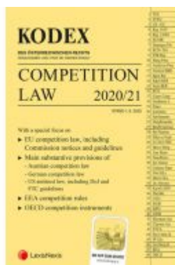
KODEX Competition Law Ladenpreis: 46,00 EUR