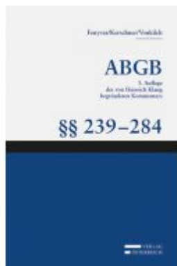
Großkommentar zum ABGB - Klang Kommentar Ladenpreis: 242,00 EUR

Wir haben andere Produkte gefunden, die Ihnen gefallen könnten!