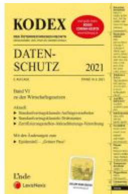
KODEX Datenschutz 2021 Ladenpreis: 65,00 EUR