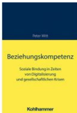
Beziehungskompetenz Ladenpreis: 32,90EUR