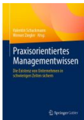
Praxisorientiertes Managementwissen Ladenpreis: 56,53EUR