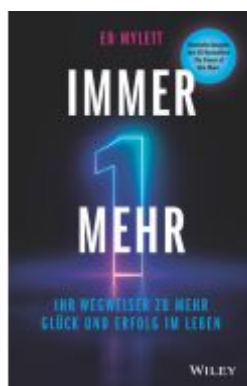
Immer eins mehr! Ladenpreis: 20,60EUR