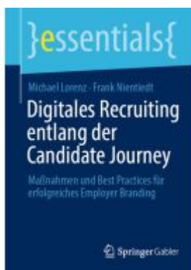
Digitales Recruiting entlang der Candidate Journey Ladenpreis: 15,41EUR