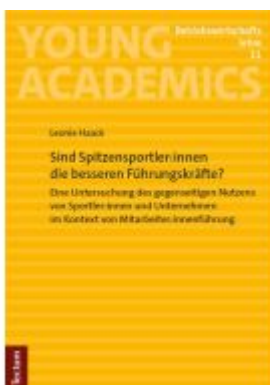
Sind Spitzensportler:innen die besseren Führungskräfte? Ladenpreis: 29,90EUR