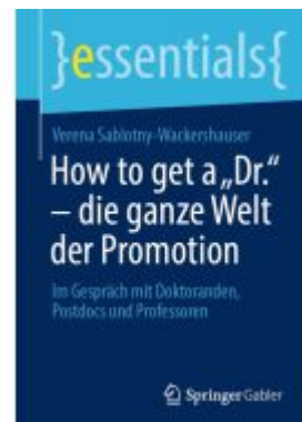
How to get a „Dr.“ – die ganze Welt der Promotion Ladenpreis: 15,41EUR