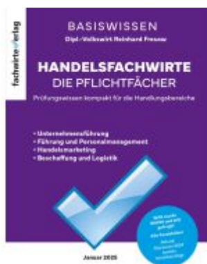
Handelsfachwirte - Die Zusammenfassung Ladenpreis: 28,80EUR