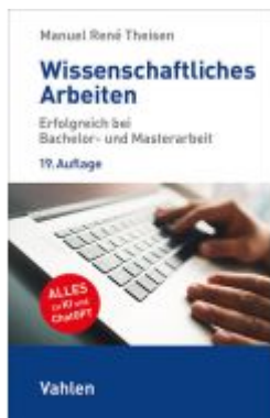
Wissenschaftliches Arbeiten Ladenpreis: 19,50EUR

Wir haben andere Produkte gefunden, die Ihnen gefallen könnten!