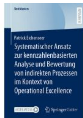
Systematischer Ansatz zur kennzahlenbasierten Analyse und Bewertung von indirekten Prozessen im Kontext von Operational Excellence Ladenpreis: 66,81EUR