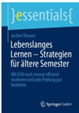
Lebenslanges Lernen – Strategien für ältere Semester Ladenpreis: 15,41EUR