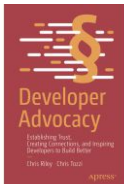
Developer Advocacy Ladenpreis: 49,49EUR

Wir haben andere Produkte gefunden, die Ihnen gefallen könnten!