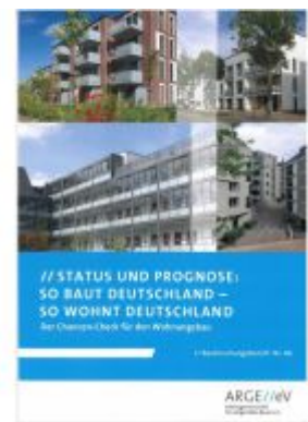
Status und Prognose: So baut Deutschland – so wohnt Deutschland. Der Chancen- Check für den Wohnungsbau Ladenpreis: 30,90EUR