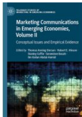
Marketing Communications in Emerging Economies, Volume II Ladenpreis: 164,99EUR