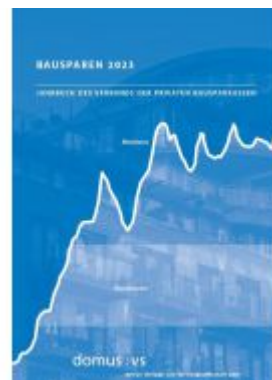
Bausparen 2023 Ladenpreis: 26,50EUR