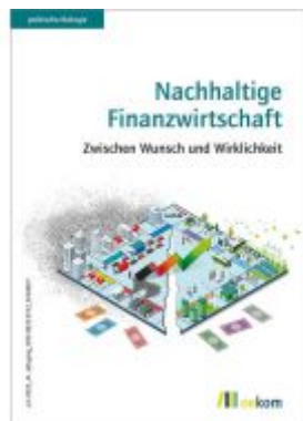
Nachhaltige Finanzwirtschaft Ladenpreis: 19,50EUR