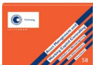
Asset Management und Working Capital Controlling Ladenpreis: 257,10EUR