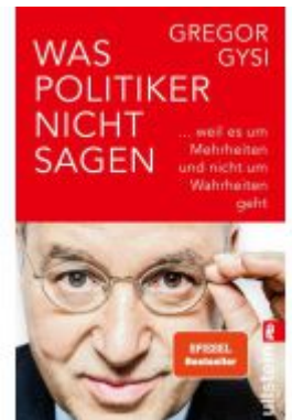
Was Politiker nicht sagen Ladenpreis: 14,40EUR