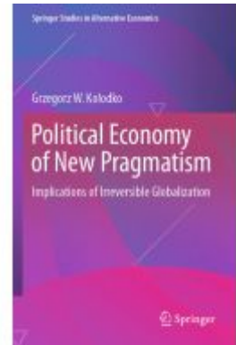
Political Economy of New Pragmatism Ladenpreis: 93,49EUR