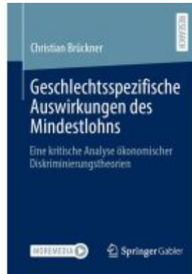
Geschlechtsspezifische Auswirkungen des Mindestlohns Ladenpreis: 92,51EUR