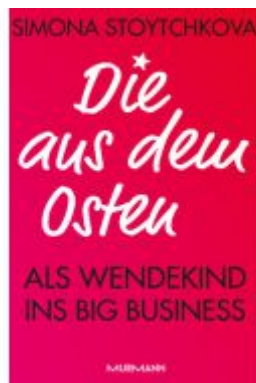
Die aus dem Osten Ladenpreis: 25,70EUR