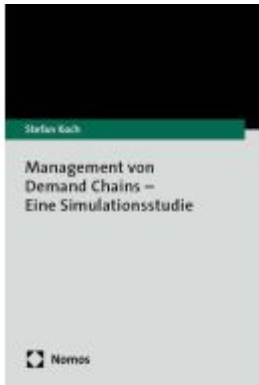
Management von Demand Chains – Eine Simulationsstudie Ladenpreis: 40,10EUR