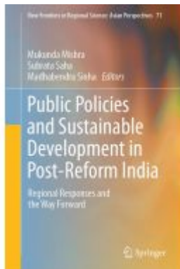
Public Policies and Sustainable Development in Post-Reform India Ladenpreis: 186,99EUR

Wir haben andere Produkte gefunden, die Ihnen gefallen könnten!