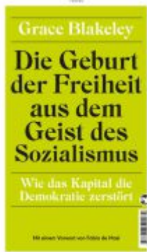
Die Geburt der Freiheit aus dem Geist des Sozialismus Ladenpreis: 28,80EUR