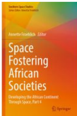
Space Fostering African Societies Ladenpreis: 164,99EUR

Wir haben andere Produkte gefunden, die Ihnen gefallen könnten!