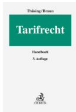
Tarifrecht Ladenpreis: 194,30EUR