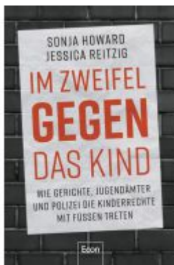
Im Zweifel gegen das Kind Ladenpreis: 21,60EUR