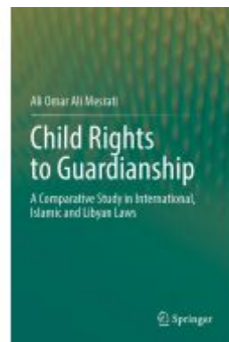
Child Rights to Guardianship Ladenpreis: 142,99EUR