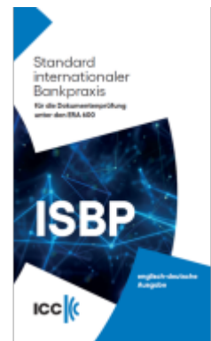
Standard internationaler Bankpraxis (ISBP) Englisch-Deutsch Ladenpreis: 29,90EUR