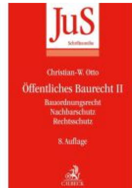
Öffentliches Baurecht II: Bauordnungsrecht, Nachbarschutz, Rechtsschutz Ladenpreis: 38,00EUR