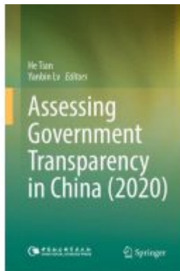
Assessing Government Transparency in China (2020) Ladenpreis: 186,99EUR