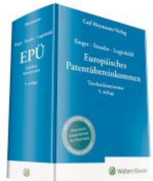
Europäisches Patentübereinkommen (EPÜ) – Kommentar Ladenpreis: 286,90EUR