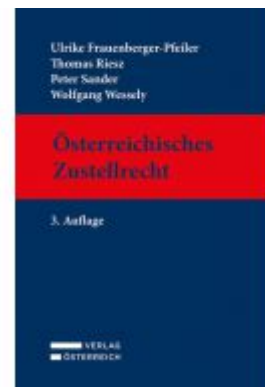
Österreichisches Zustellrecht Ladenpreis: 169,00 EUR