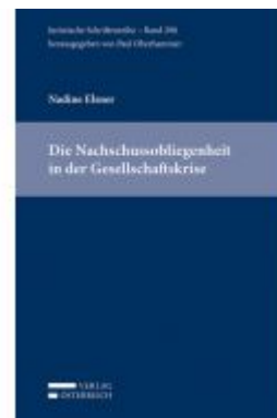
Die Nachschussobligation in der Gesellschaftskrise Ladenpreis: 79,00 EUR