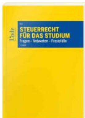
Steuerrecht für das Studium Ladenpreis: 39,00 EUR