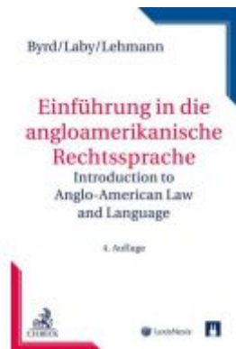
Einführung in die anglo-amerikanische Rechtssprache Ladenpreis: 39,00 EUR