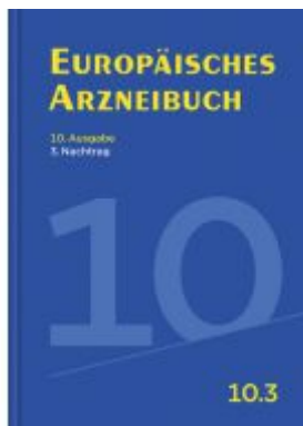
Europäisches Arzneibuch Ladenpreis: 57,20 EUR