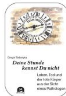
Deine Stunde kennst Du nicht Ladenpreis: 25,50EUR