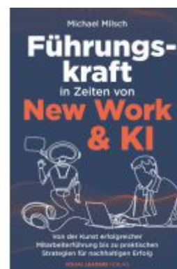
Führungskraft in Zeiten von New Work & KI Ladenpreis: 18,50EUR