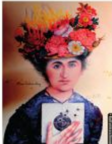
Fiktion und Wirklichkeit Ladenpreis: 32,90EUR

Julia Killet Fiktion und Wirklichkeit: Die Darstellung Rosa Luxemburgs in der biographischen und literarischen Prosa