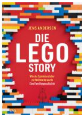
Die LEGO-Story Ladenpreis: 37,10EUR