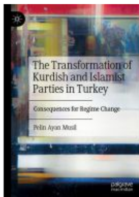
The Transformation of Kurdish and Islamist Parties in Turkey Ladenpreis: 153,99EUR