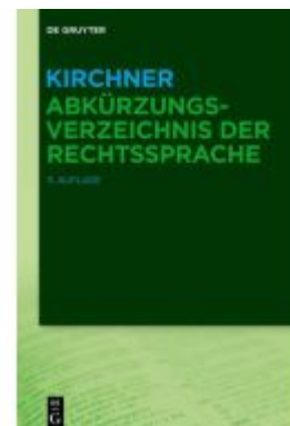
Kirchner – Abkürzungsverzeichnis der Rechtssprache Ladenpreis: 99,95EUR