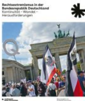
Rechtsextremismus in der Bundesrepublik Deutschland Ladenpreis: 10,30EUR