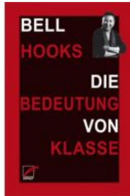
Die Bedeutung von Klasse Ladenpreis: 16,50EUR