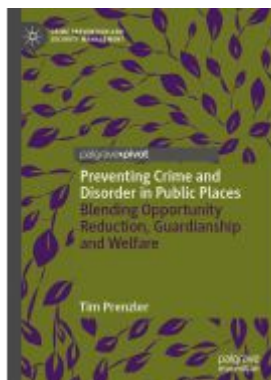
Preventing Crime and Disorder in Public Places Ladenpreis: 43,99EUR