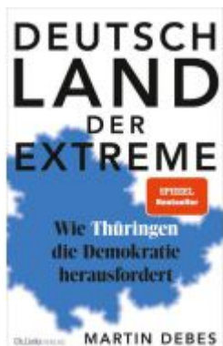
Deutschland der Extreme Ladenpreis: 20,60EUR

Wir haben andere Produkte gefunden, die Ihnen gefallen könnten!