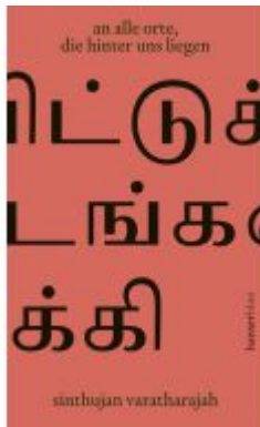
an alle orte, die hinter uns liegen Ladenpreis: 24,70EUR