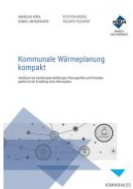
Kommunale Wärmeplanung kompakt Ladenpreis: 132,70EUR