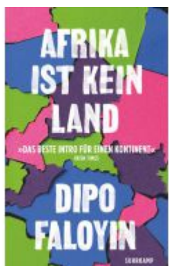
Afrika ist kein Land Ladenpreis: 14,40EUR