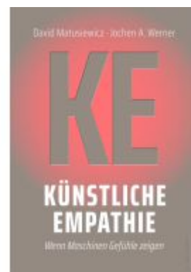
Künstliche Empathie Ladenpreis: 25,70EUR