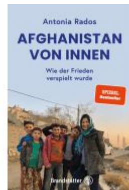
Afghanistan von innen Ladenpreis: 25,00EUR