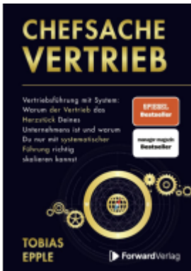
Chefsache Vertrieb Ladenpreis: 24,90EUR