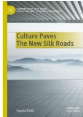
Culture Paves The New Silk Roads Ladenpreis: 98,99EUR