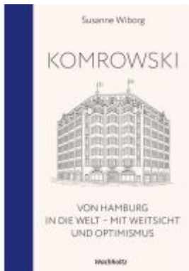
Komrowski. Von Hamburg in die Welt. Ladenpreis: 40,10EUR