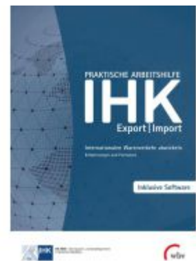
Praktische Arbeitshilfe Export/Import 2022 Ladenpreis: 51,30EUR