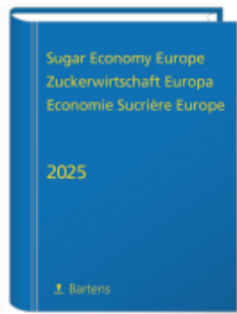
Sugar Economy Europe Zuckerwirtschaft Europa Economie Sucrière Europe 2025 Ladenpreis: 60,50EUR