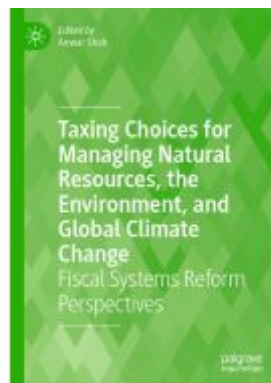
Taxing Choices for Managing Natural Resources, the Environment, and Global Climate Change Ladenpreis: 186,99EUR