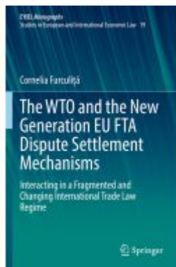
The WTO and the New Generation EU FTA Dispute Settlement Mechanisms Ladenpreis: 153,99EUR