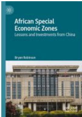
African Special Economic Zones Ladenpreis: 142,99EUR