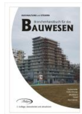
BAUWESEN Ladenpreis: 74,80EUR