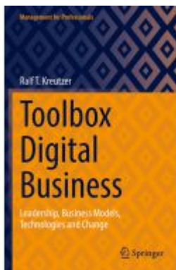
Toolbox Digital Business Ladenpreis: 87,99EUR