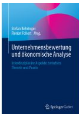
Unternehmensbewertung und ökonomische Analyse Ladenpreis: 56,53EUR