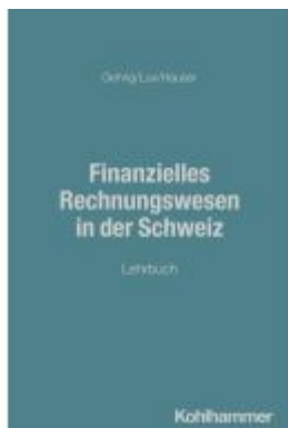
Finanzielles Rechnungswesen in der Schweiz Ladenpreis: 50,40EUR