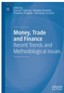
Money, Trade and Finance Ladenpreis: 175,99EUR