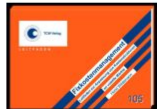
Fixkostenmanagement Ladenpreis: 257,10EUR