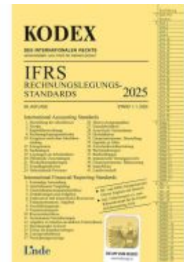
KODEX IFRS - Rechnungslegungsstandards 2025 Ladenpreis: 35,00EUR