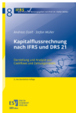
Kapitalflussrechnung nach IFRS und DRS 21 Ladenpreis: 41,10EUR