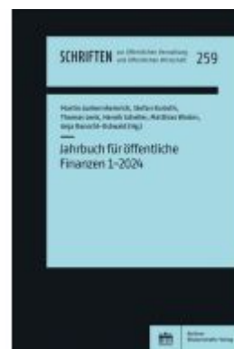
Jahrbuch für öffentliche Finanzen (2024) 1 Ladenpreis: 79,20EUR