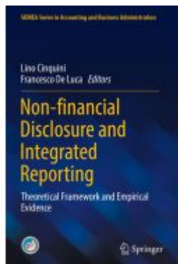
Non-financial Disclosure and Integrated Reporting Ladenpreis: 186,99EUR

Wir haben andere Produkte gefunden, die Ihnen gefallen könnten!