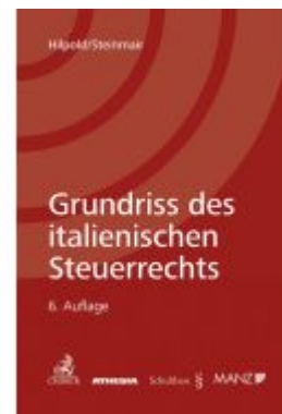
Grundriss des italienischen Steuerrechts I Ladenpreis: 79,00EUR