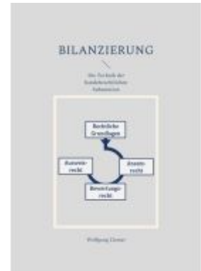
Bilanzierung Ladenpreis: 13,30EUR