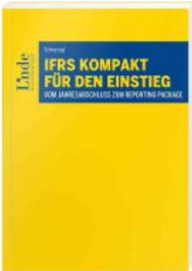
IFRS kompakt für den Einstieg Ladenpreis: 28,00EUR