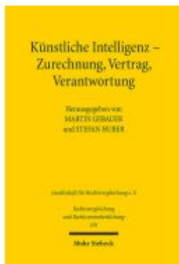
Künstliche Intelligenz - Zurechnung, Vertrag, Verantwortung Ladenpreis: 60,70EUR