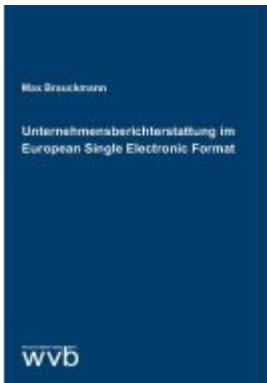
Unternehmensberichterstattung im European Single Electronic Format Ladenpreis: 37,10EUR