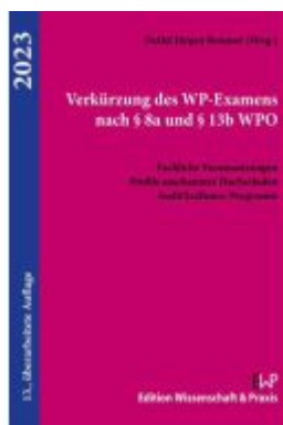
Verkürzung des WP-Examens nach § 8a und § 13b WPO. Ladenpreis: 25,60EUR