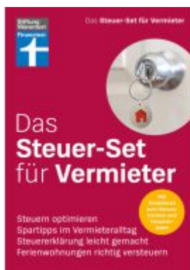
Das Steuer-Set für Vermieter Ladenpreis: 17,40EUR