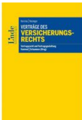
Verträge des Versicherungsrechts Ladenpreis: 48,00 EUR