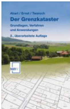
Der Grenzkataster Ladenpreis: 24,80 EUR