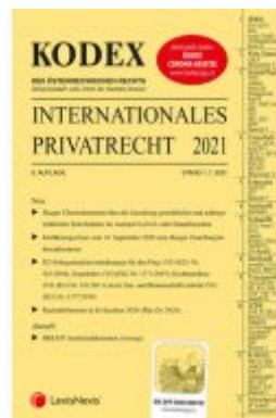
KODEX Internationales Privatrecht 2021 Ladenpreis: 34,00 EUR