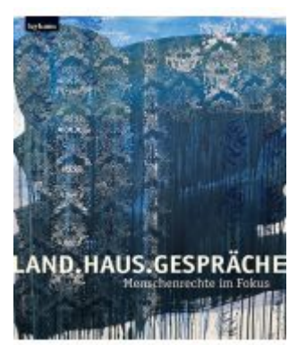
Land.Haus.Gespräche. Menschenrechte im Fokus Ladenpreis: 29,00 EUR