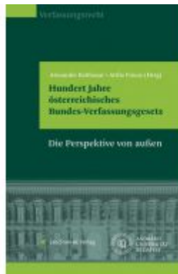
Hundert Jahre österreichisches Bundes- Verfassungsgesetz Ladenpreis: 85,00 EUR