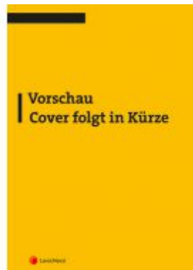
Bürgerliches Recht - graphisch dargestellt (Skriptum) Ladenpreis: 25,00 EUR