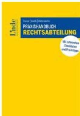
Praxishandbuch Rechtsabteilung Ladenpreis: 79,00EUR

Wir haben andere Produkte gefunden, die Ihnen gefallen könnten!