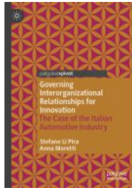
Governing Interorganizational Relationships for Innovation Ladenpreis: 38,49EUR