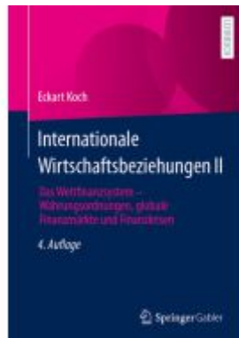
Internationale Wirtschaftsbeziehungen II Ladenpreis: 39,06EUR