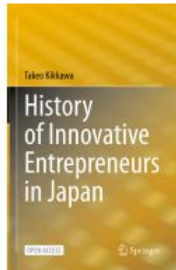
History of Innovative Entrepreneurs in Japan Ladenpreis: 54,99EUR