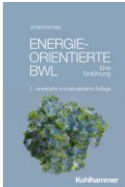
Energieorientierte BWL Ladenpreis: 40,10EUR