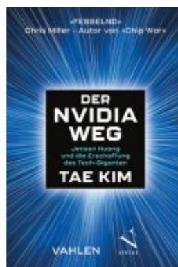
Der Nvidia-Weg Ladenpreis: 26,90EUR