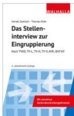
Das Stelleninterview zur Eingruppierung Ladenpreis: 16,95EUR