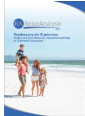
Reiseanalyse 2023: Kurzfassung der Ergebnisse Ladenpreis: 290,00EUR