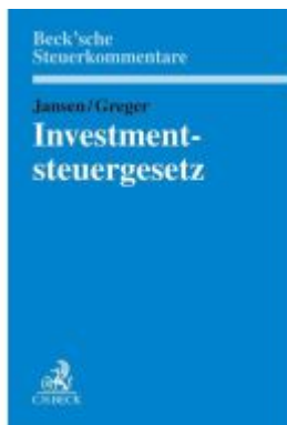
Investmentsteuergesetz Ladenpreis: 204,60EUR