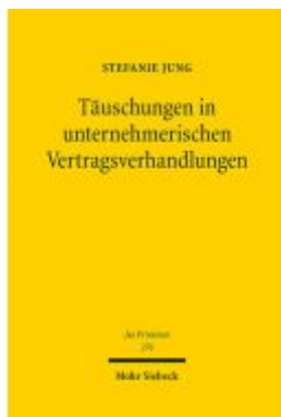
Täuschungen in unternehmerischen Vertragsverhandlungen Ladenpreis: 163,50EUR