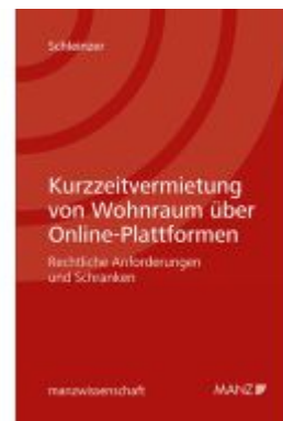
Kurzzeitvermietung von Wohnraum über Online-Plattformen Ladenpreis: 68,00EUR