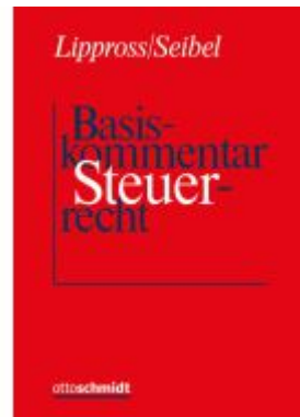
Basis-Kommentar Steuerrecht Ladenpreis: 203,60EUR