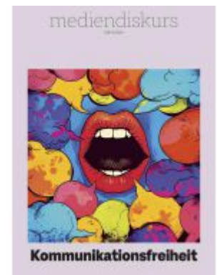
Kommunikationsfreiheit Ladenpreis: 24,70EUR