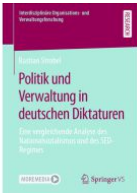
Politik und Verwaltung in deutschen Diktaturen Ladenpreis: 82,24EUR