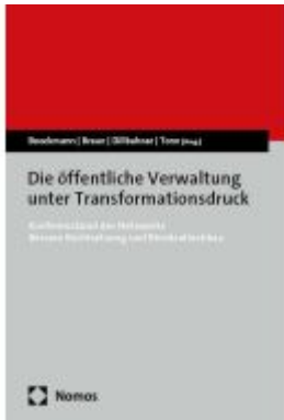
Die öffentliche Verwaltung unter Transformationsdruck Ladenpreis: 45,30EUR