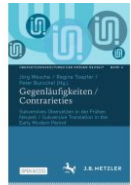
Gegenläufigkeiten / Contrarities Ladenpreis: 43,99EUR