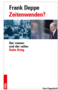
Zeitenwenden? Ladenpreis: 15,30EUR