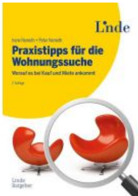
Praxistipps für die Wohnungssuche Ladenpreis: 29,90EUR