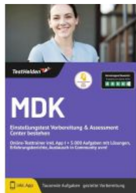
MDK Einstellungstest Vorbereitung & Assessment Center bestehen: Online-Testtrainer inkl. App I + 5.000 Aufgaben mit Lösungen, Erfahrungsbereichte, Austausch in Community uvm! Ladenpreis: 41,10EUR