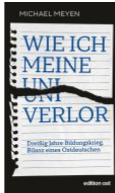
Wie ich meine Uni verlor Ladenpreis: 15,50EUR