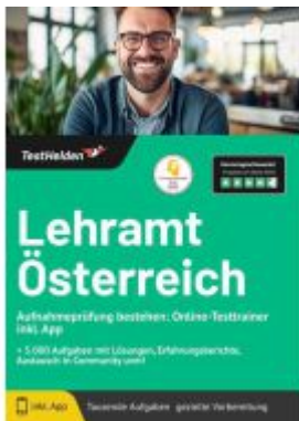
Lehramt Österreich Aufnahmeprüfung bestehen: Online-Testtrainer inkl. App I + 5.000 Aufgaben mit Lösungen, Erfahrungsberichte, Austausch in Community uvm! Ladenpreis: 41,10EUR