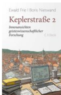
Keplerstraße 2 Ladenpreis: 30,80EUR