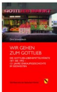
Wir gehen zum Gottlieb Ladenpreis: 28,80EUR