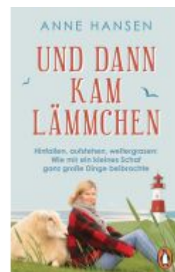
Und dann kam Lämmchen Ladenpreis: 13,40EUR