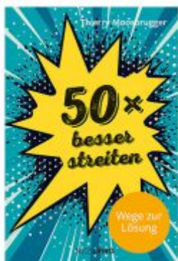
50 x besser streiten Ladenpreis: 28,80EUR