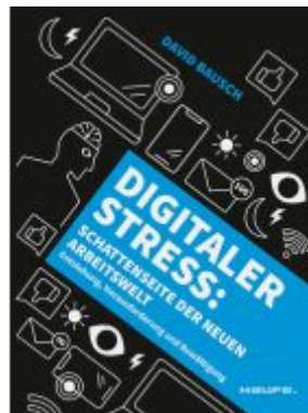
Digitaler Stress: Schattenseite der neuen Arbeitswelt Ladenpreis: 30,90EUR