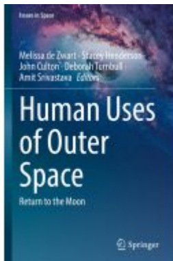
Human Uses of Outer Space Ladenpreis: 164,99EUR