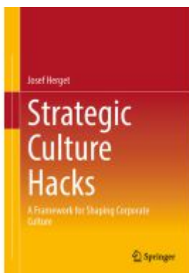
Strategic Culture Hacks Ladenpreis: 65,99EUR