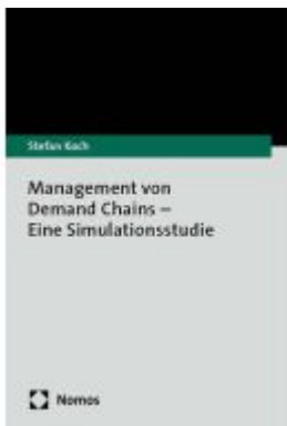
Management von Demand Chains – Eine Simulationsstudie Ladenpreis: 40,10EUR