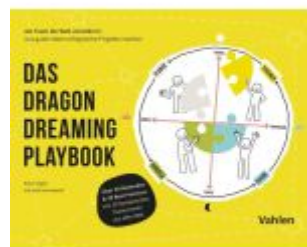
Das Dragon Dreaming Playbook Ladenpreis: 35,90EUR