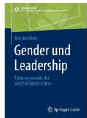
Gender und Leadership Ladenpreis: 39,06EUR