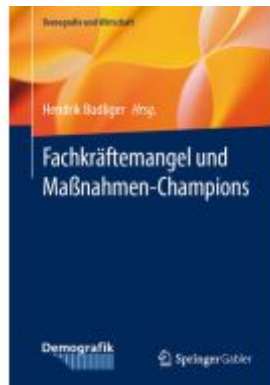
Fachkräftemangel und Maßnahmen- Champions Ladenpreis: 46,25EUR