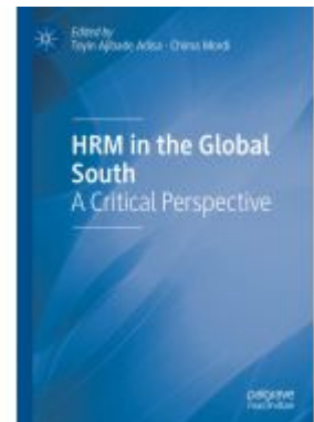
HRM in the Global South Ladenpreis: 186,99EUR