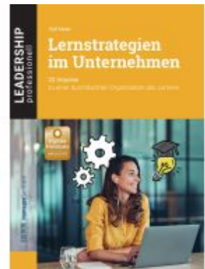
Lernstrategien im Unternehmen Ladenpreis: 51,30EUR