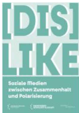
DisLike Ladenpreis: 13,30EUR