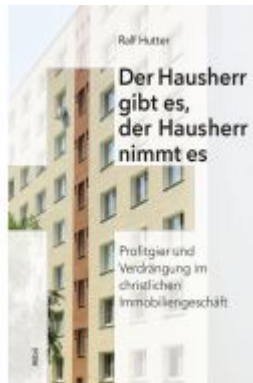
Der Hausherr gibt es, der Hausherr nimmt es Ladenpreis: 18,50EUR