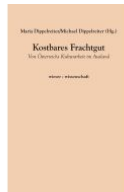
Kostbares Frachtgut Ladenpreis: 20,00EUR