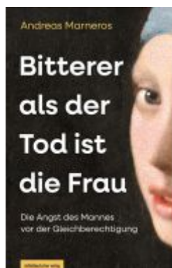
Bitterer als der Tod ist die Frau Ladenpreis: 32,90EUR