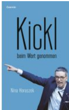
Kickl beim Wort genommen Ladenpreis: 20,00EUR