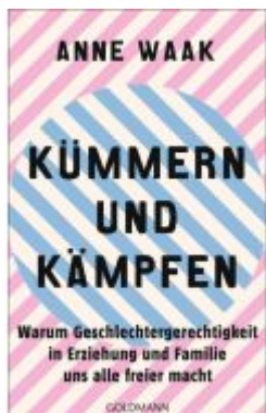
Kümmern und Kämpfen Ladenpreis: 18,50EUR

Wir haben andere Produkte gefunden, die Ihnen gefallen könnten!