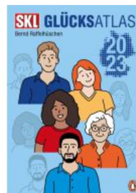
SKL Glücksatlas 2023 Ladenpreis: 20,60EUR