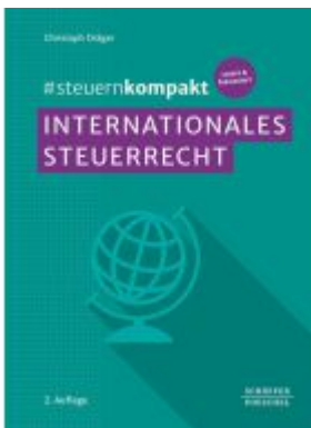
#steuernkompakt Internationales Steuerrecht Ladenpreis: 36,00EUR