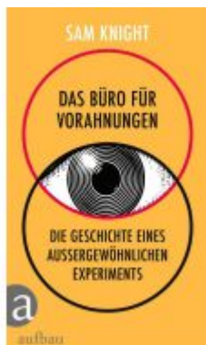
Das Büro für Vorahnungen Ladenpreis: 26,80EUR