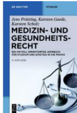
Medizin- und Gesundheitsrecht Ladenpreis: 39,95EUR