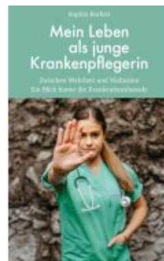
Mein Leben als junge Krankenpflegerin Ladenpreis: 25,00EUR