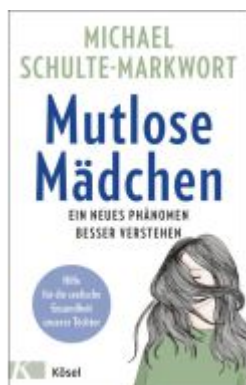
Mutlose Mädchen Ladenpreis: 22,70EUR