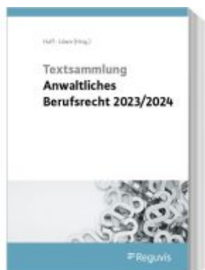
Textsammlung anwaltliches Berufsrecht 2023/2024 Ladenpreis: 30,70EUR