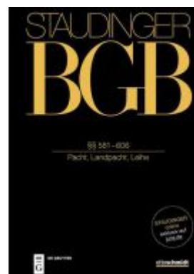
§§ 581-606 Ladenpreis: 299,00EUR