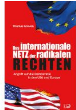
Das internationale Netz der radikalen Rechten Ladenpreis: 22,70EUR