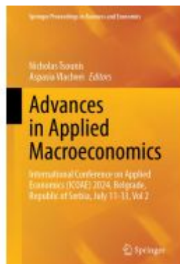
Advances in Applied Macroeconomics Ladenpreis: 274,99EUR