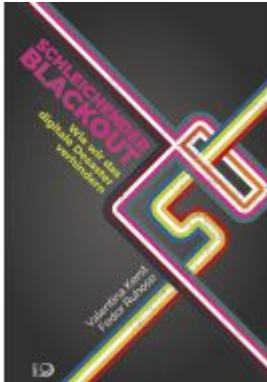
Schleichender Blackout Ladenpreis: 19,50EUR