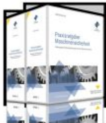
Praxisratgeber Maschinensicherheit: Fallbezogene Handlungsanleitungen nach den neuen MaschinenRL Ladenpreis: 213,90EUR

Wir haben andere Produkte gefunden, die Ihnen gefallen könnten!