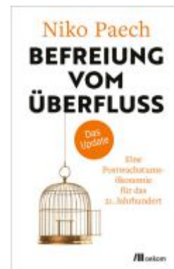
Befreiung vom Überfluss – das Update Ladenpreis: 18,50EUR