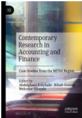
Contemporary Research in Accounting and Finance Ladenpreis: 175,99EUR