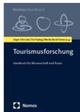
Tourismusforschung Ladenpreis: 101,80EUR