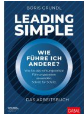
Leading Simple – Das Arbeitsbuch Ladenpreis: 51,40EUR