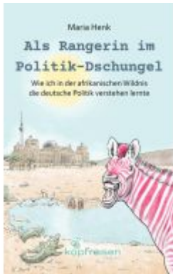
Als Rangerin im Politik-Dschungel Ladenpreis: 14,40EUR