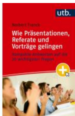
Mein nächster Auftritt: Wie Präsentationen, Referate und Vorträge gelingen Ladenpreis: 18,50EUR