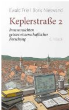
Keplerstraße 2 Ladenpreis: 30,80EUR