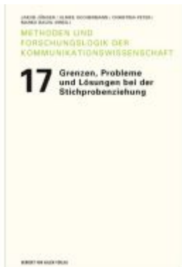
Grenzen, Probleme und Lösungen bei der Stichprobenziehung Ladenpreis: 32,90EUR