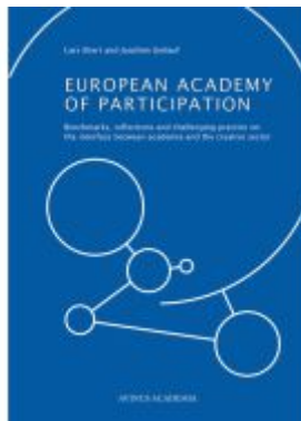
European Academy of Participation Ladenpreis: 16,50EUR