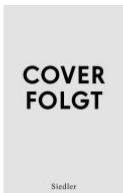
ON MY WATCH Ladenpreis: 32,90EUR