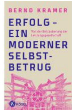
Erfolg – ein moderner Selbstbetrug Ladenpreis: 18,50EUR