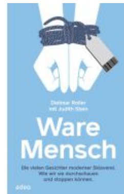
Ware Mensch Ladenpreis: 15,40EUR