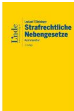
Leukauf/Steininger Strafrechtliche Nebengesetze Ladenpreis: 198,00EUR