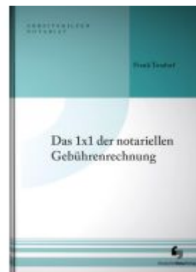
Das 1x1 der notariellen Gebührenrechnung Ladenpreis: 40,10EUR