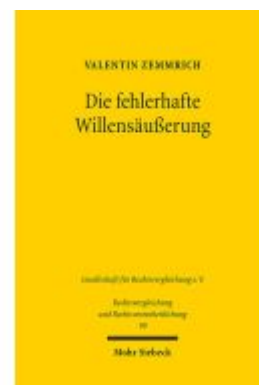
Die fehlerhafte Willensäußerung Ladenpreis: 86,40EUR