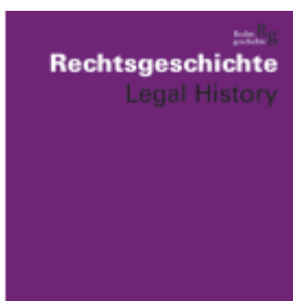
Rechtsgeschichte Legal History (RG). Zeitschrift des Max Planck-Instituts für Rechtsgeschichte und Rechtslehre/ Journal of Legal History and Legal Theory History Ladenpreis: 50,40EUR