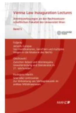
Vienna Law Inauguration Lectures Antrittsvorlesungen an d. rechtswissenschaftlichen Fakultät der Universität Wien Ladenpreis: 29,60EUR