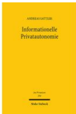
Informationelle Privatautonomie Ladenpreis: 96,70EUR