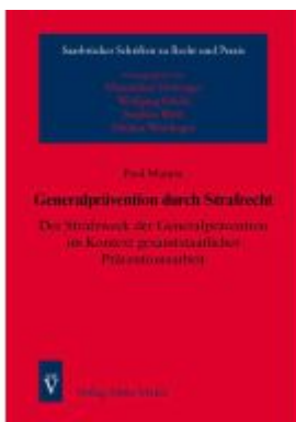
Generalprävention durch Strafrecht Ladenpreis: 49,40EUR