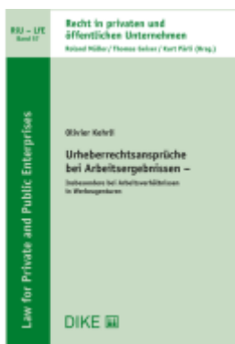
Urheberrechtsansprüche bei Arbeitsergebnissen – insbesondere bei Arbeitsverhältnissen in Werbeagenturen Ladenpreis: 68,00EUR