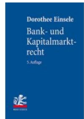
Bank- und Kapitalmarktrecht Ladenpreis: 153,20EUR