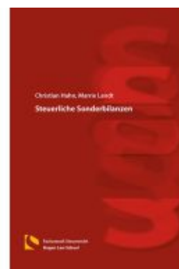
Steuerliche Sonderbilanzen Ladenpreis: 25,70EUR