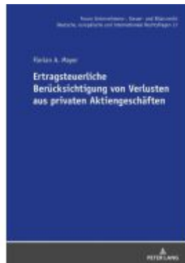
Ertragsteuerliche Berücksichtigung von Verlusten aus privaten Aktiengeschäften Ladenpreis: 82,20EUR