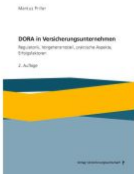
DORA in Versicherungsunternehmen Ladenpreis: 82,10EUR