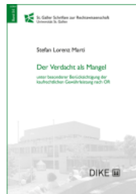
Der Verdacht als Mangel Ladenpreis: 92,00EUR