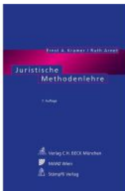
Juristische Methodenlehre Ladenpreis: 69,00EUR