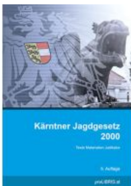
Kärntner Jagdgesetz 2000 Ladenpreis: 28,00EUR