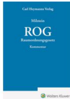
ROG – Kommentar Ladenpreis: 163,50EUR