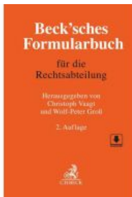
Beck'sches Formularbuch für die Rechtsabteilung Ladenpreis: 204,60EUR