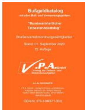
Original-Bußgeldkatalog der Polizei Ladenpreis: 6,20EUR