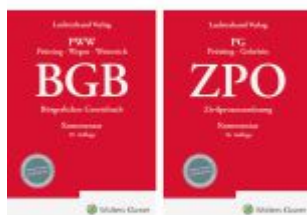
Bundle BGB Kommentar 19. Auflage und ZPO Kommentar 16. Auflage Ladenpreis: 245,70EUR