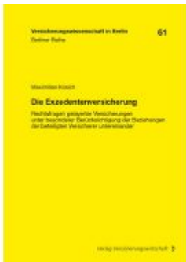
Die Exzedentenversicherung Ladenpreis: 46,10EUR