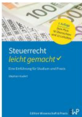
Steuerrecht – leicht gemacht. Ladenpreis: 16,40EUR