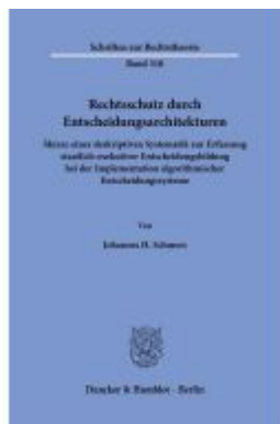
Rechtsschutz durch Entscheidungsarchitekturen. Ladenpreis: 92,50EUR