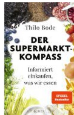
Der Supermarkt-Kompass Ladenpreis: 22,70EUR