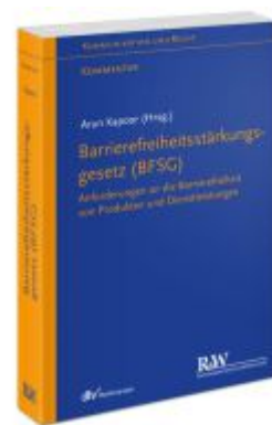
Barrierefreiheitsstärkungsgesetz (BFSG) Ladenpreis: 132,70EUR