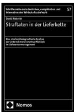
Straftaten in der Lieferkette Ladenpreis: 178,90EUR