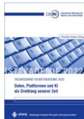
Daten, Plattformen und KI als Dreiklang unserer Zeit Ladenpreis: 71,80EUR