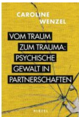
Vom Traum zum Trauma. Psychische Gewalt in Partnerschaften. Ladenpreis: 24,70EUR