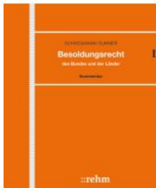
Besoldungsrecht des Bundes und der Länder Ladenpreis: 973,60EUR