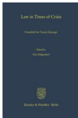
Law in Times of Crisis. Ladenpreis: 174,70EUR