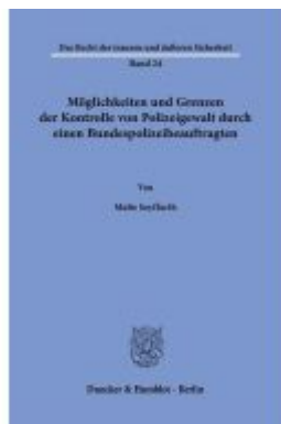
Möglichkeiten und Grenzen der Kontrolle von Polizeigewalt durch einen Bundespolizeibeauftragten. Ladenpreis: 92,50EUR