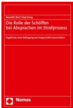
Die Rolle der Schöffen bei Absprachen im Strafprozess Ladenpreis: 55,60EUR

Wir haben andere Produkte gefunden, die Ihnen gefallen könnten!