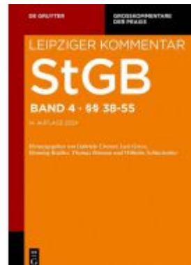
Strafgesetzbuch. Leipziger Kommentar / §§ 38-55 Ladenpreis: 229,00EUR