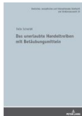
Das unerlaubte Handeltreiben mit Betäubungsmitteln Ladenpreis: 79,10EUR